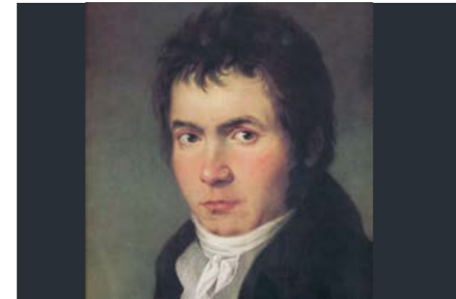
Gemälde: Josef Willibrod Mähler, 1778-1860