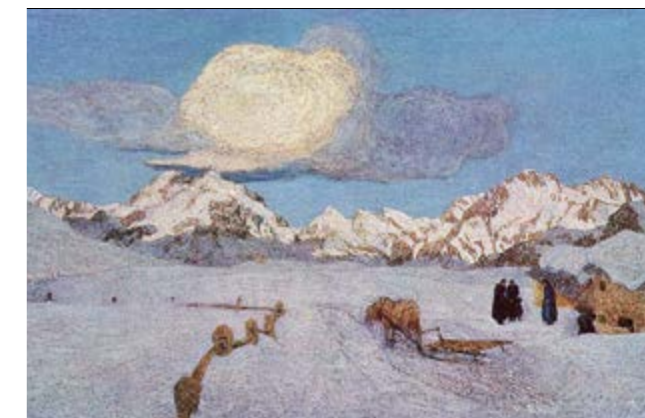
Giovanni Segantini's Gemälde «la morte»