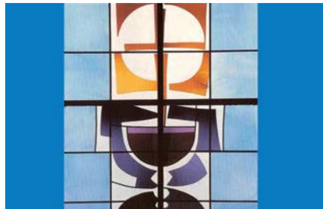
Foto ref. Kirche Neftenbach