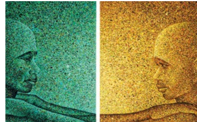
Hundertuch 2017 und 2018